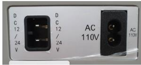
連接電源(內置變壓器版)